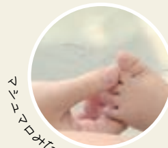
マシュマロみたいにモチモチ～

お母さん方から意外な赤ちゃんの真実を知ることができておもしろかった。赤ちゃんのことが大好きだという気持ちがとても伝わった。赤ちゃんに触ったら、本当にマシュマロみたいにモチモチしていて可愛かった。