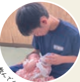
ミルク飲んでくれたよ～