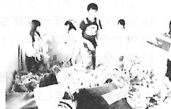
新聞紙プールで大はしゃぎ！

子どもたちのかわいさ、素直さ、笑顔にとってもいやされました。小さい子にとって親がどれだけ大切な存在かもわかりました。