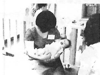
赤ちゃんってやわらかい

まつど市民活動サポートセンターが主催する、若者対象の夏のボランティア「Let's 体験」。ハーモニーの3か所の受け入れ施設に、今年も中高生・大学生がたくさん来てくれました。来館者やスタッフとのふれあい、交流を通してお互いに「気付かなかった大切なこと」が見えたひとときでした。