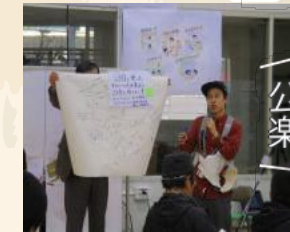
公園をもっと楽しくしたい！