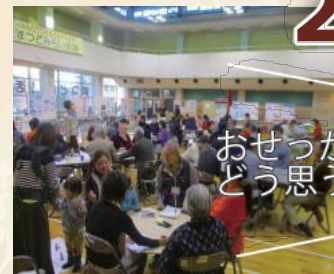
おせっかいってどう思う？