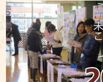
未来の松戸はこうしたい！