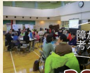
障がいについて考えたい！