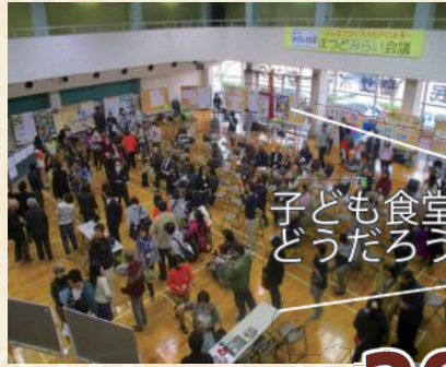
子ども食堂はどうだろう？