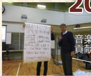
音楽で地域に貢献したい！