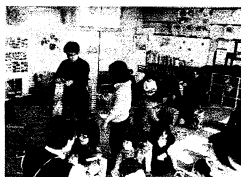
カブラであそぼ(2007.11) 子どもより夢中になった パパとママ

今年には新たに、外で遊ぶ楽しさを味わってもらおうと月1回広場を外に移して、「公園遊び」を行っています。ダンボール遊び、どろんこ遊び、水鉄砲、しゃぼん玉など外でしかできない遊びを企画中です。